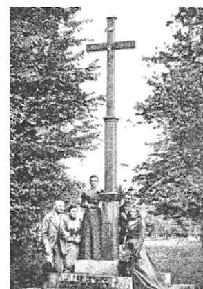
Croix de l'ermitage du Tilleul