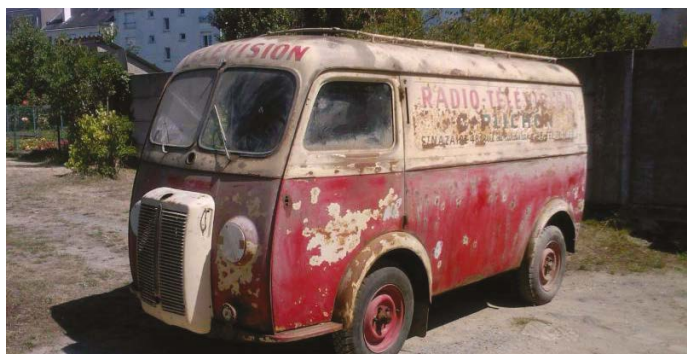
Camion Chenard et Walcker